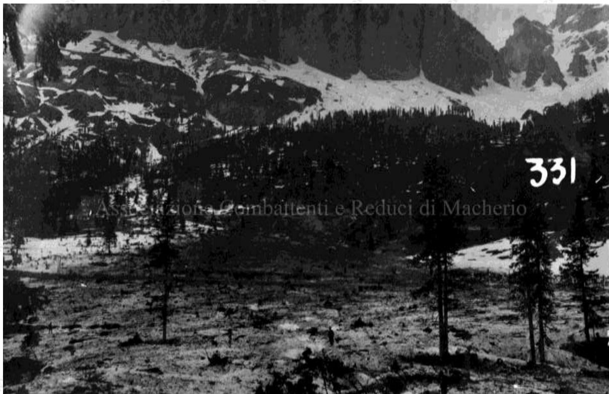
La foto ritrae un paesaggio post valanga: con molta probabilità si tratta di questa, data la portata e la devastazione che causò

Albo dei Caduti: da Vernate (d.m. di Monza), Soldato 3° Regg.Artiglieria da Montagna, morto il 13/12/1916 sul Monte Tofane in seguito a caduta di valanga