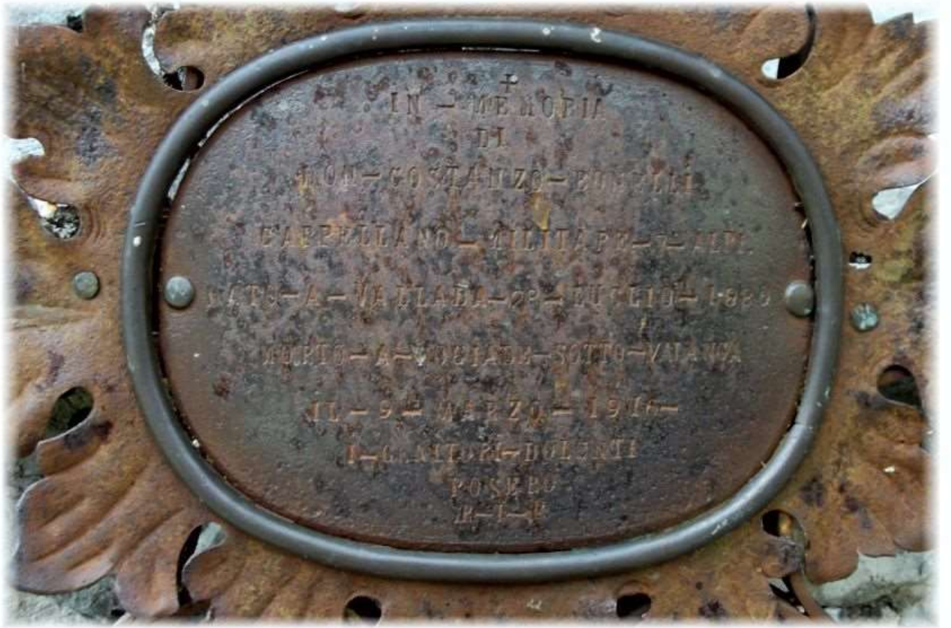
Targa posta nell'ex-cimitero militare di Fuchiade dedicata al Cappellano Don Costanzo, una delle vittime della valanga