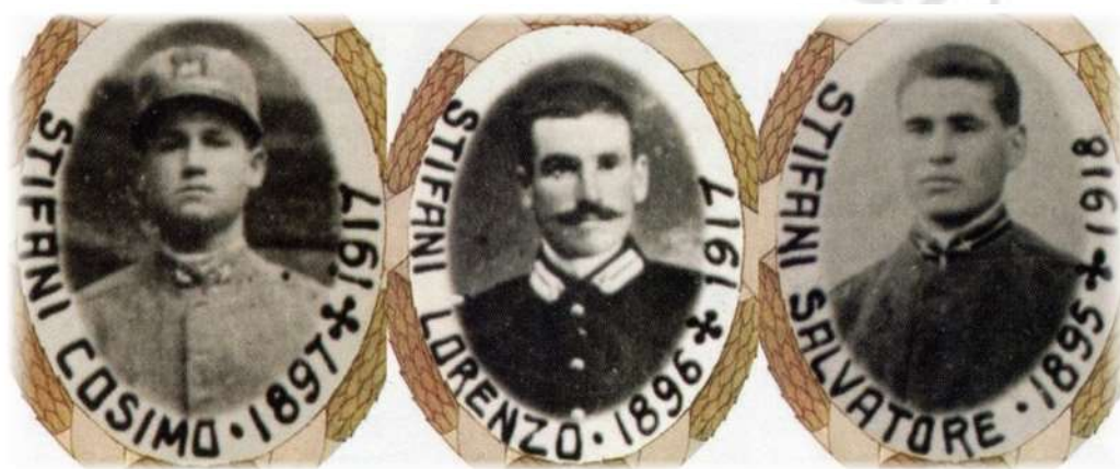
Foto tratta dal libro: Albo d'Oro dei caduti e decorati della provincia di Lecce di Elio Pindinelli