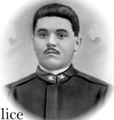
Fratelli Totti di Conselice